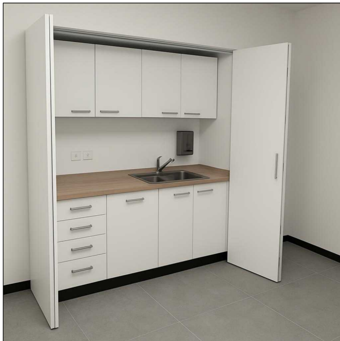
MEBEL _ SK-1